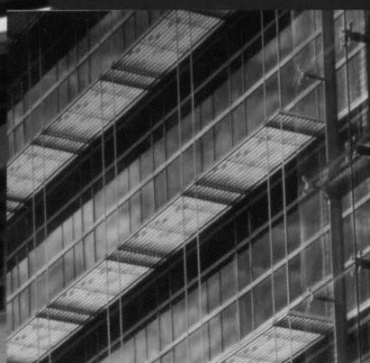
TECNOLOGIE INNOVATIVE DI INVOLUCRO