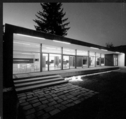
ASILO NIDO IN OSPEDALE